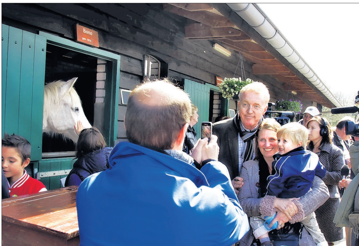
André van Duin gaat op de foto met fans bij de stal van Bono in De Paardenkamp.